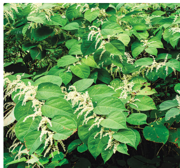
Poligono del Giappone