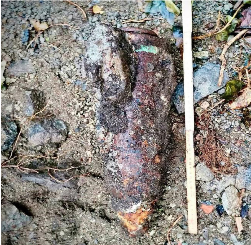
Ordigno trovato in via Cruseta a Bironico venerdì 6 settembre 2024.

In questo numero del nostro bollettino vi vogliamo fornire alcune informazioni sui servizi organizzati dal Comune e da enti esterni, gli avvenimenti particolari del nostro territorio e alcune comunicazioni utili, come quelle sulle neofite invasive. In copertina la foto del vecchio ordigno militare ritrovato a Bironico nel corso di questo mese, che ha creato una situazione di emergenza per la quale ringraziamo tutta la cittadinanza per la comprensione e la disponibilità avuta durante questo particolare evento. Ringraziamo anche sentitamente tutti gli enti di primo intervento per il loro operato e collaborazione. Vi auguriamo una piacevole lettura a nome del Municipio e dell'Amministrazione comunale.