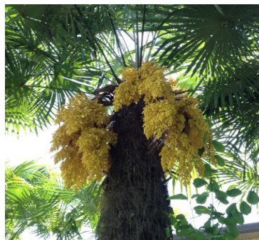
Palma di Fortune